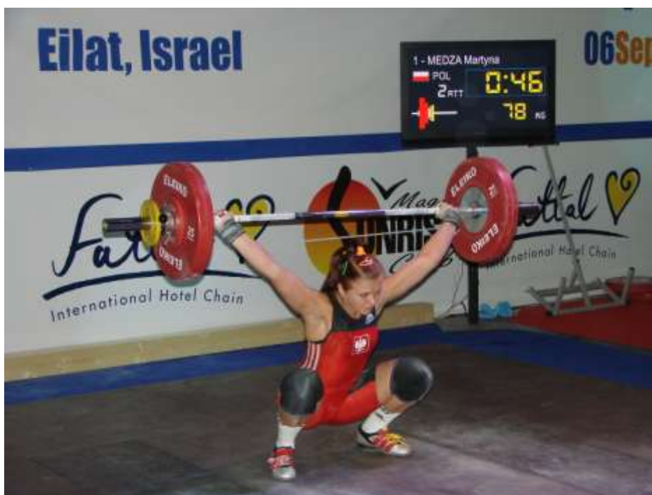
Fot. Martyna Męcza na mistrzostwach Europy w Eolat